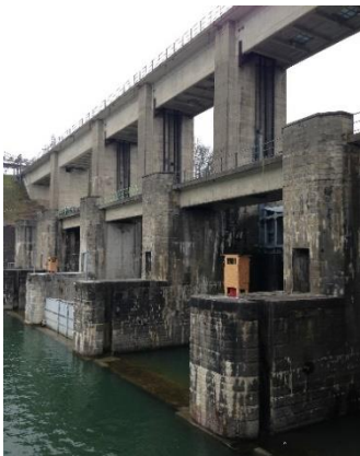
Barrage de Chancy, suivi des injections et boîte de communication.