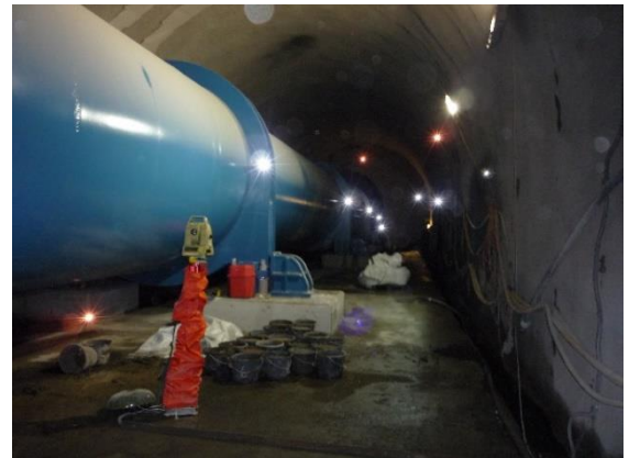
Suivi de la mise en charge du puits blindé de cleuson-Dixence.